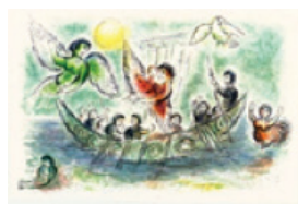
Marc Chagall, Ulysse et les Sirènes , 1974-1975, Lithographie pour l'Odyssee BNF, réserve des livres rares.