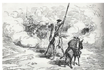
Gustave Doré, Don Quichotte , Gravure, 1863.