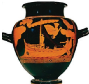
Peinture sur poterie, «Ulysse et les sirènes», 475 avant J.C. Céramique, hauteur 32,2cm, British Museum, Londres.