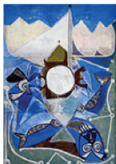
Pablo Picasso, Ulysse et les sirènes , 1947, Musée Picasso d'Antibes.